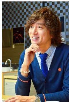
学校法人 菊地学園理事長