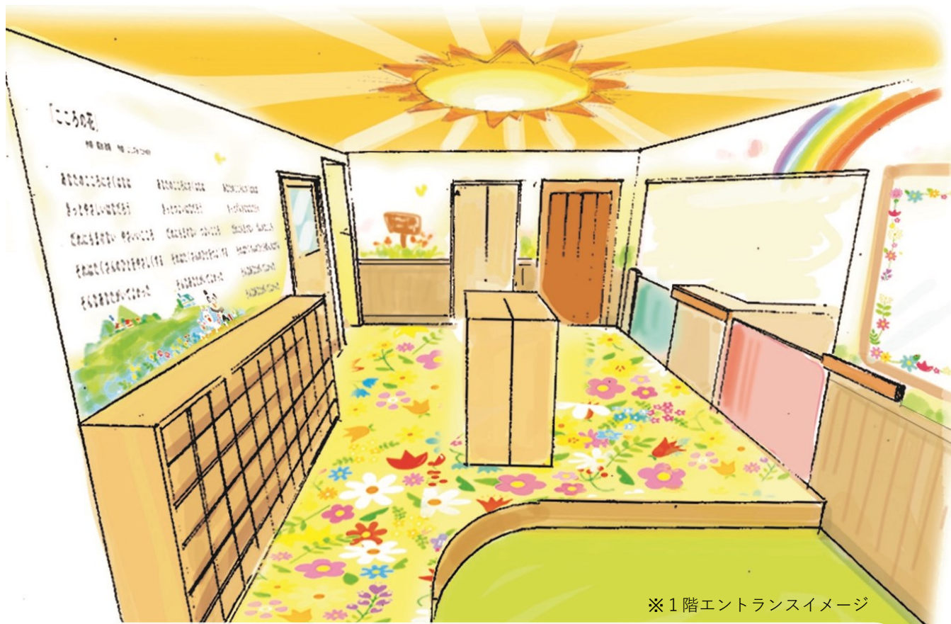
※1階エントランスイメージ