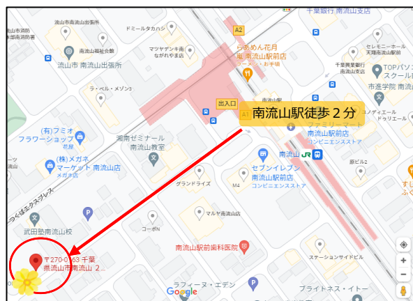
JR武蔵野線・つくばエクスプレス 南流山駅徒歩2分

学校法人菊地学園 〒343-0032 埼玉県越谷市袋山631番地3 TEL 048-977-8031